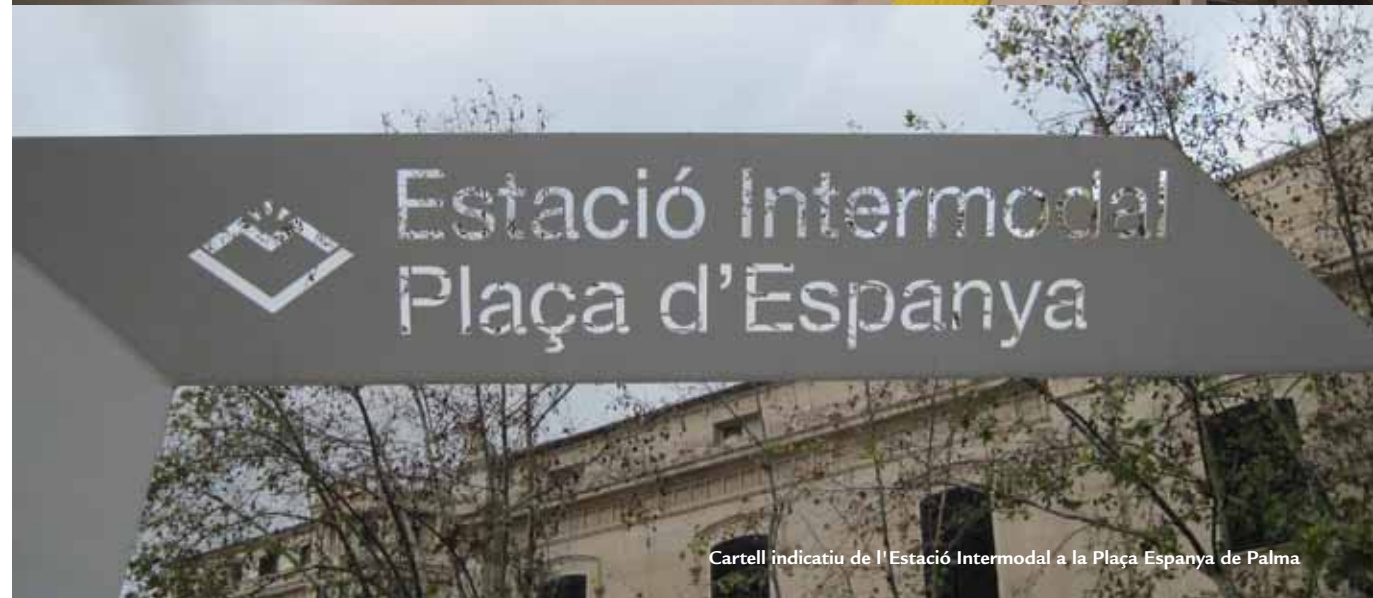
Cartell indicatiu de l'Estació Intermodal a la Plaça Espanya de Palma