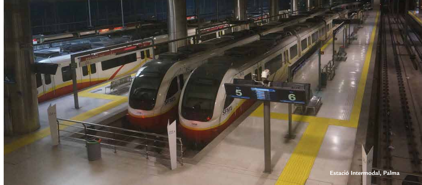
Estació Intermodal, Palma